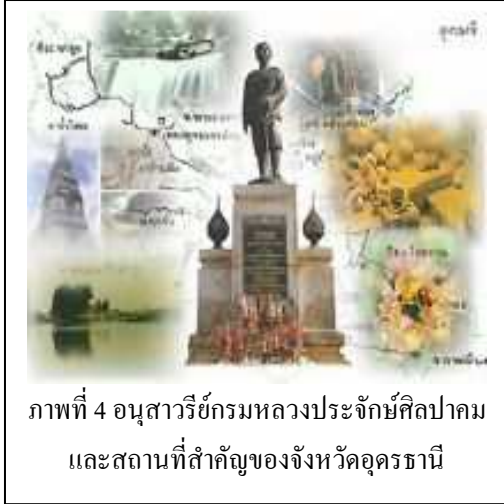
ภาพที่ 4 อนุสาวรีย์กรมหลวงประจักษ์ศิลปาคม และสถานที่สำคัญของจังหวัดอุดรธานี

ดังนั้น หน่วยทหารไทยที่ตั้งประอยู่ที่เมืองหนองคาย อันเป็นเมืองศูนย์กลางของหัวเมือง หรือ