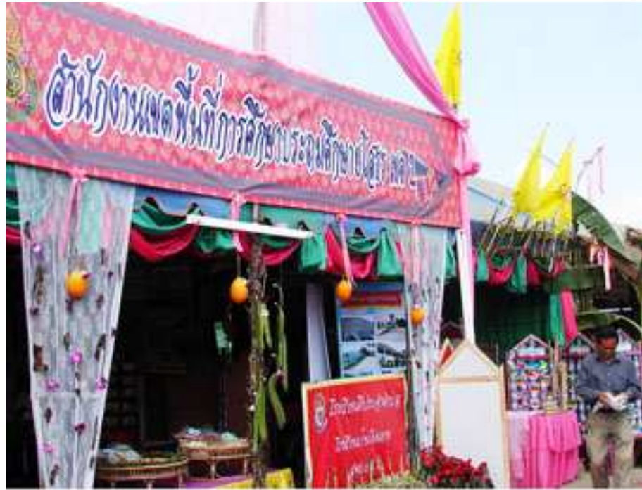
ภาพที่ 28 ร้านนิทรรศการ สปป.ยโสธร เขต 2