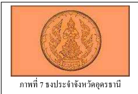
ภาพที่ 7 ธงประจำจังหวัดอุดรธานี

เป็นธงรูปสี่เหลี่ยมผืนผ้าสีแสด มีรูปท้าวเวสสุวรรณ ซึ่งเป็นดวงตราประจำจังหวัด อยู่ กลางผืนธง