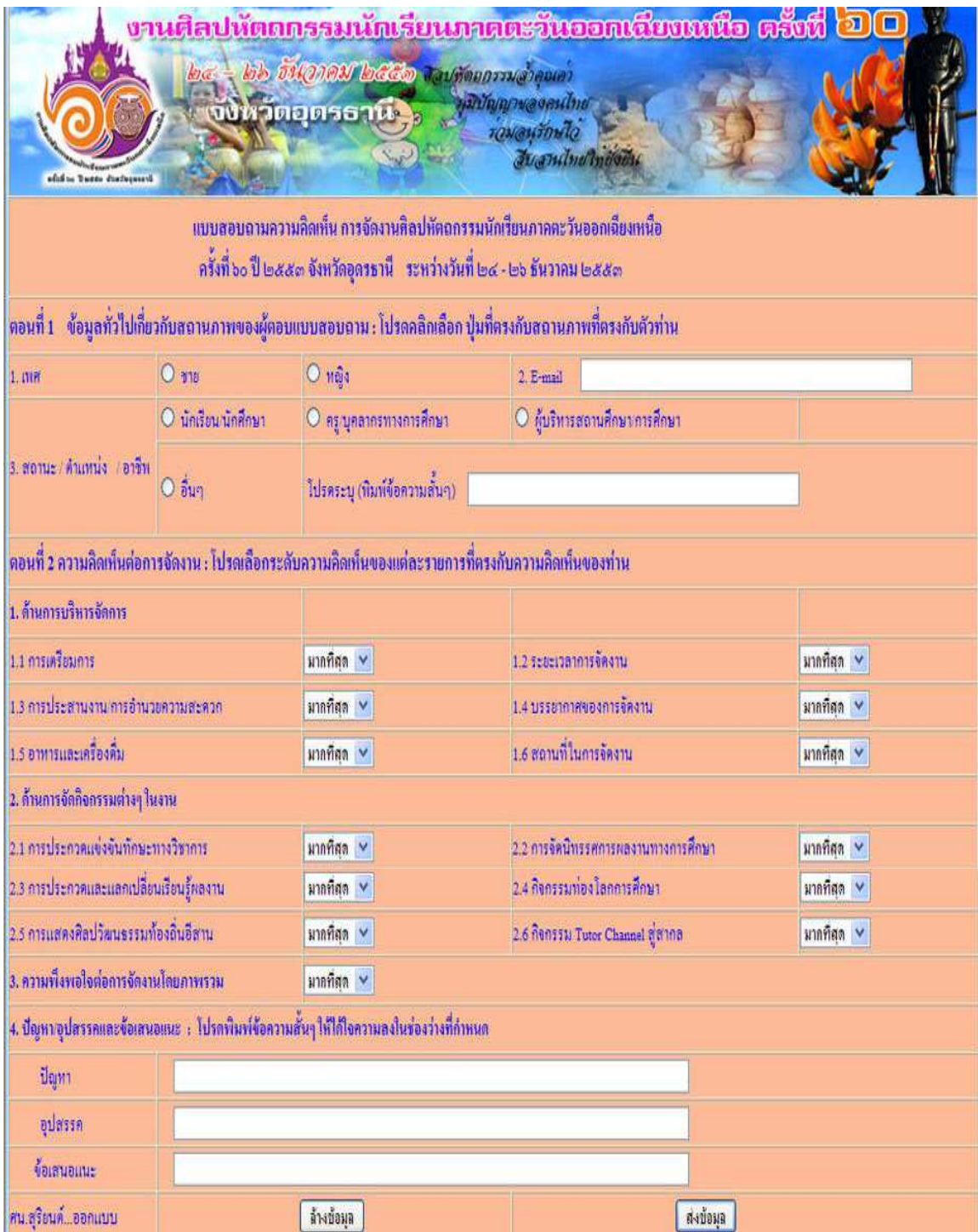
ภาพที่ 13 แบบสอบถามแบบอิเล็กทรอนิกส์