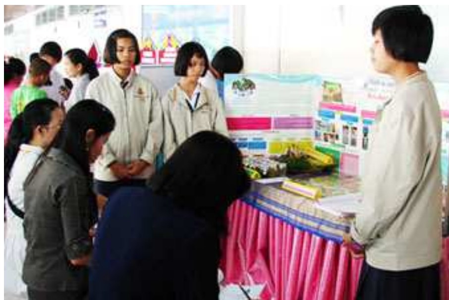
ภาพที่ 17 นำเสนอโครงงานคณิต