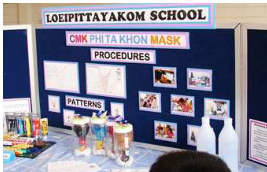
ภาพที่ 16 โครงงานคณิตศาสตร์