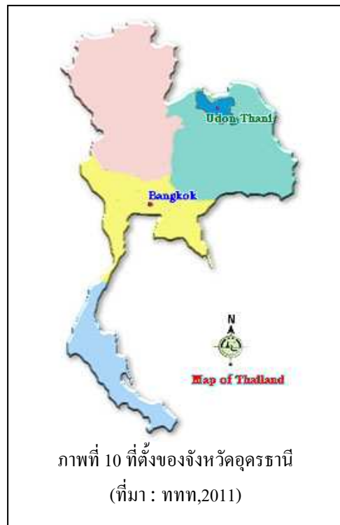
ภาพที่ 10 ที่ตั้งของจังหวัดอุดรธานี

จังหวัดอุดรธานีตั้งอยู่ที่ราบสูงภาคตะวันออกเฉียงเหนือของประเทศไทย เป็นดินแดนที่มีอารยธรรมเก่าแก่แห่งหนึ่งของโลก ตั้งอยู่บนเส้นรุ้งที่ 17 องศาเหนือ เส้นแวงที่ 103 องศาตะวันออก อยู่ทางทิศตะวันออกเฉียงเหนือของประเทศไทย ห่างจากกรุงเทพฯ 564 กิโลเมตร มีพื้นที่ทั้งหมด 11,730.30 ตารางกิโลเมตรหรือประมาณ 7.362 ล้านไร่ เป็นจังหวัดที่มีพื้นที่ มากเป็นอันดับ 4 ใน 19 จังหวัดของภาคตะวันออกเฉียงเหนือ และเป็นอันดับที่ 11 ของประเทศ (คิดเป็นร้อยละ 2.29 ของพื้นที่ประเทศ)