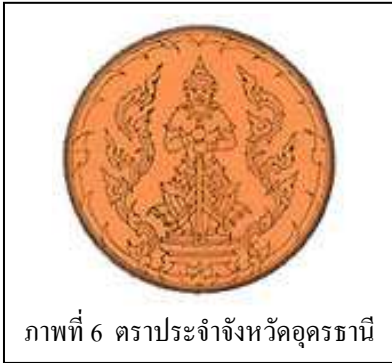
ภาพที่ 6 ตราประจำจังหวัดอุดรธานี

เป็นรูปท้าวเวสสุวรรณหรือท้าวภูเวร หมายถึง เทพดา ผู้คุ้มครองรักษาประจำ ทิศอุดร ยืนถือกระบองเฝ้ารักษา เมือง กรมศิลปากร ออกแบบตั้งแต่ พ.ศ.2483 (วิกิพีเดีย สารานุกรมเสรี,2011)