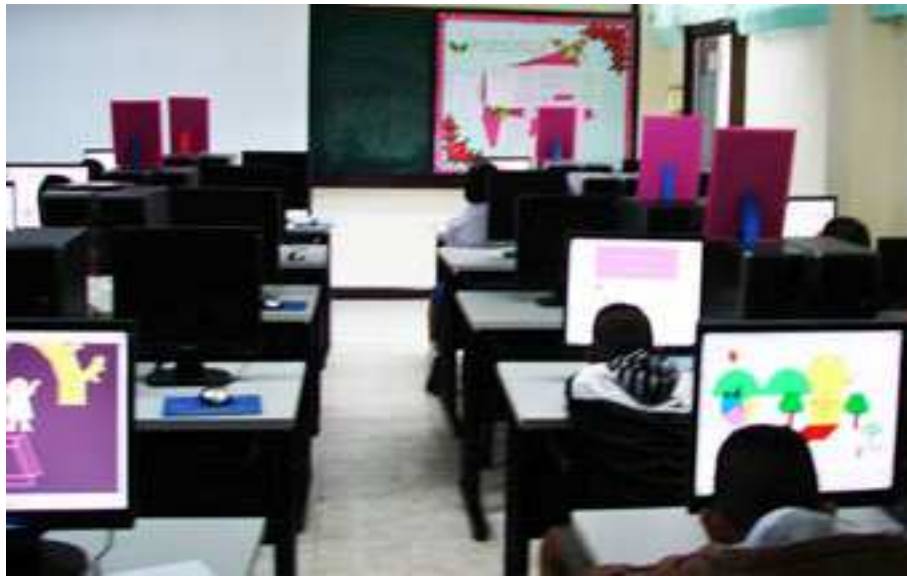
ภาพที่ 18 แข่งขัน GSP