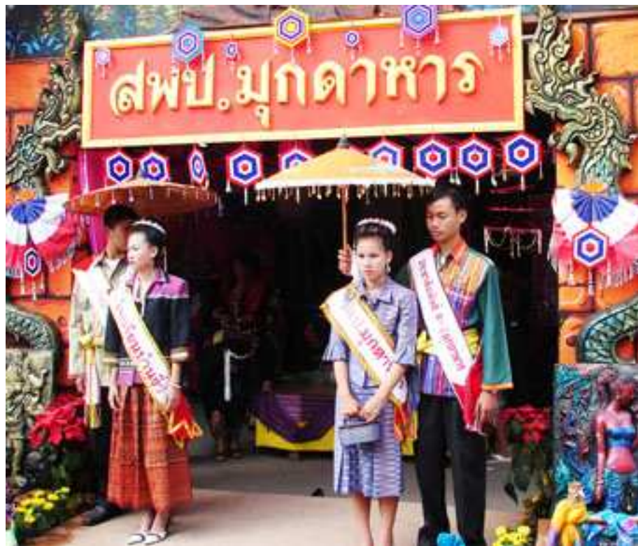
ภาพที่ 29 ร้านนิทรรศการ สปป.มุกดาหาร