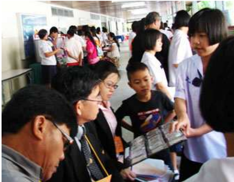
ภาพที่ 24 การนำเสนอโครงการวิทยาศาสตร์