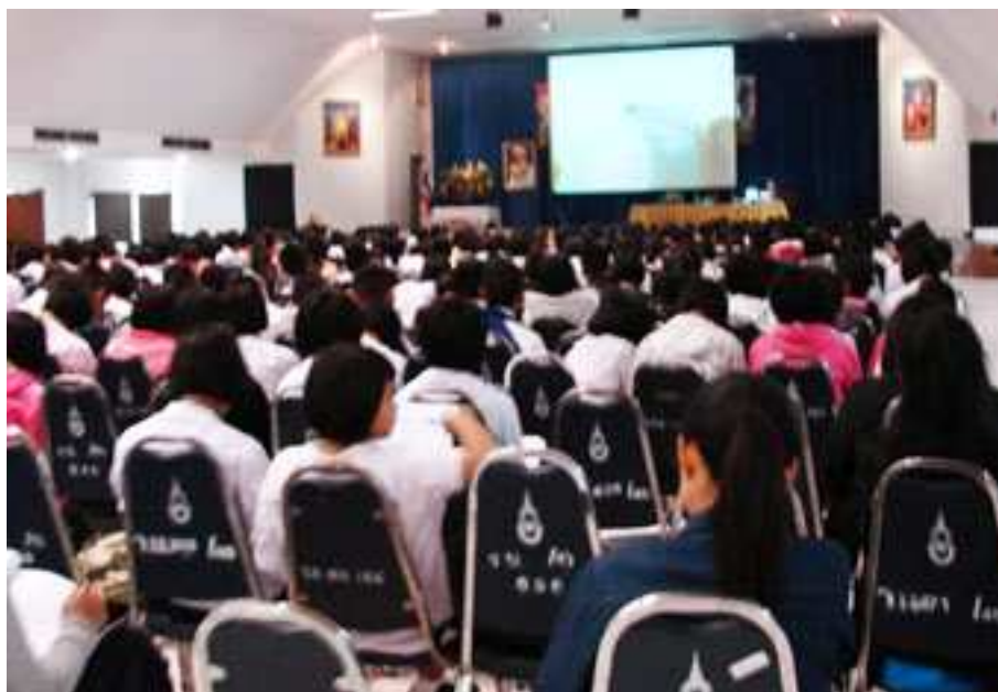
ภาพที่ 26 กิจกรรม Tutor Channel สู่สากล