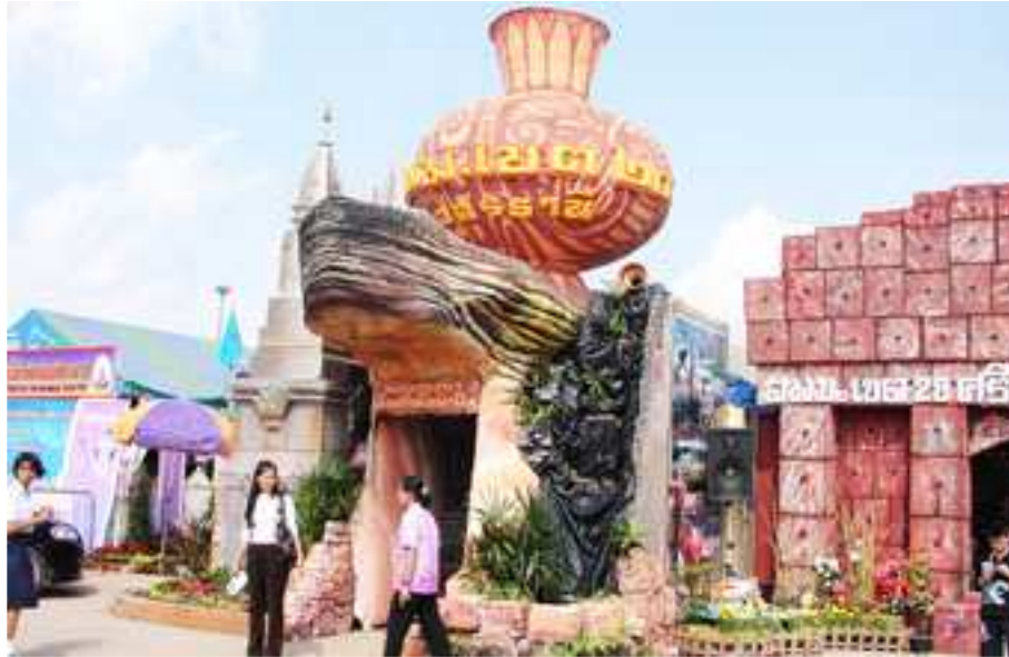
ภาพที่ 32 ร้านนิทรรศการ สพม.