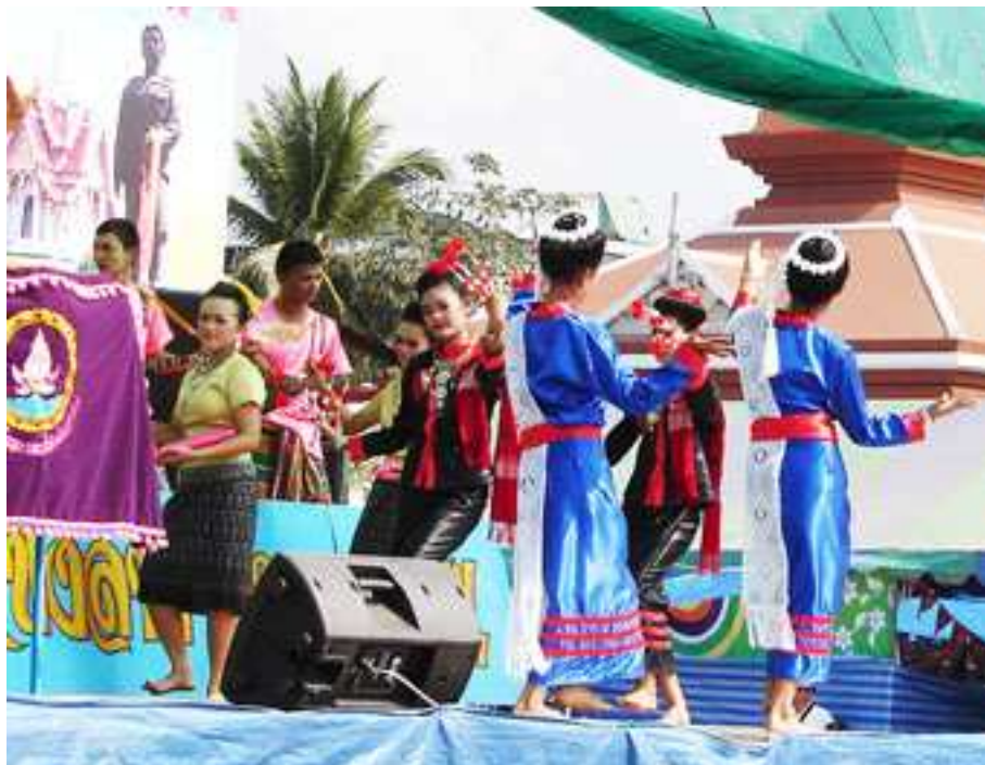
ภาพที่ 19 การแสดงวงดนตรีพื้นเมือง