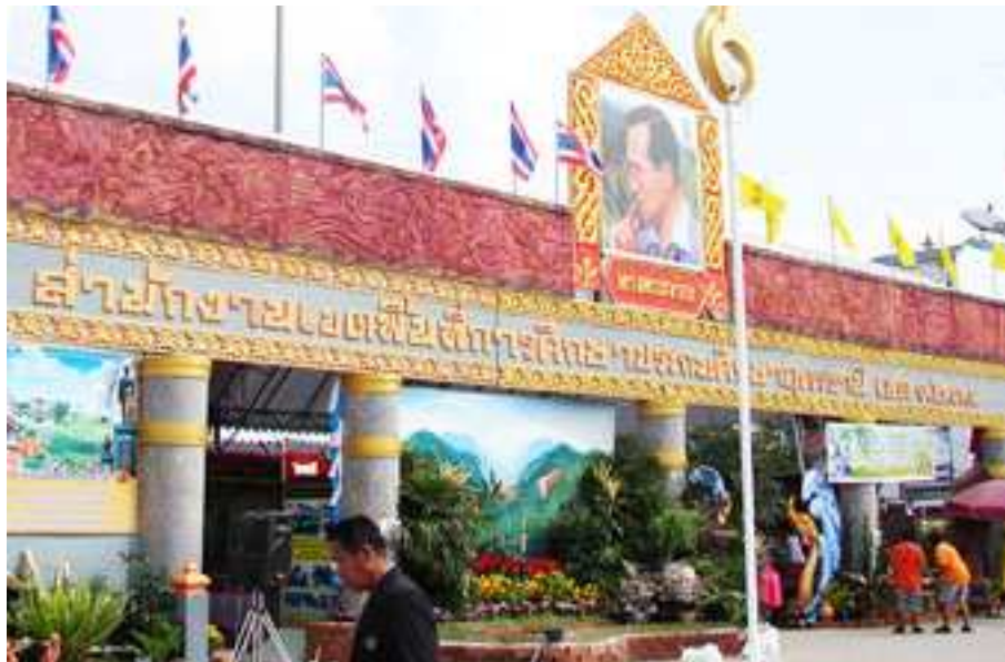
ภาพที่ 27 ร้านนิทรศการ สarp. ในจังหวัดอุดรธานี