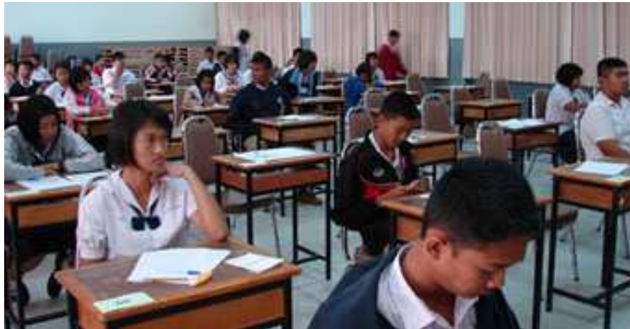
ภาพที่ 14 การแข่งขันคิดเลขเร็ว