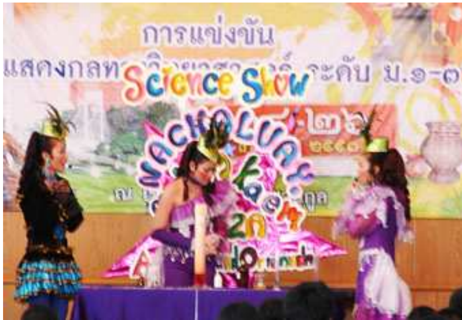
ภาพที่ 25 มายากลวิทยาศาสตร์