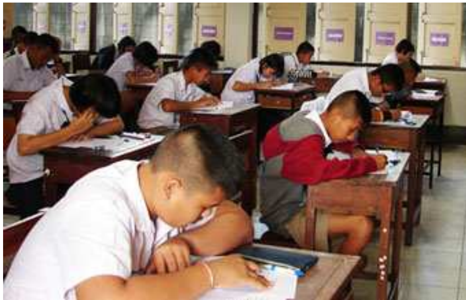
ภาพที่ 15 แข่งขันทักษะทางคณิตศาสตร์