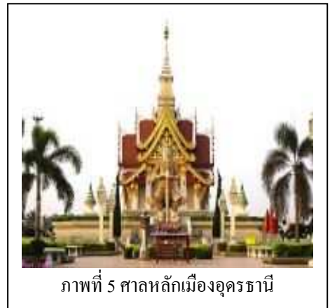
ภาพที่ 5 ศาลหลักเมืองอุดรธานี

มณฑลอุดรจึงถูกยุบเลิกไป เหลือเพียง จังหวัด "อุดรธานี" เท่านั้น (กลุ่มข้อมูลสารสนเทศ ,สนจ.อด.,2011)