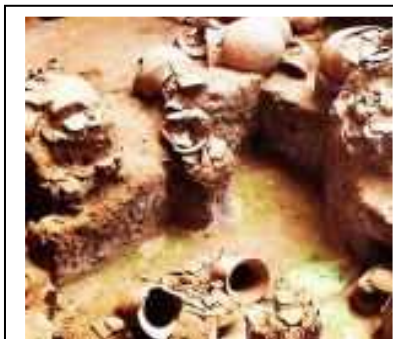
ภาพที่ 2 เครื่องปั้นดินเผาบ้านเชียง

จากหลักฐานทางประวัติศาสตร์และโบราณคดีพบว่า บริเวณพื้นที่ ที่เป็นจังหวัดอุดรธานีในปัจจุบัน เคยเป็นถิ่นที่อยู่ของมนุษย์มาตั้งแต่สมัยก่อนประวัติศาสตร์ประมาณ 5,000-7,000 ปี จากหลักฐานการค้นพบที่บ้านเชียงอำเภอหนองหาน และภาพเขียนสีบนผนังถ้ำที่อำเภอ บ้านผือ เป็นสิ่งที่แสดงให้เห็นเป็นอย่างดีจนเป็นที่ยอมรับนับถือในวงการศึกษาศาสตร์