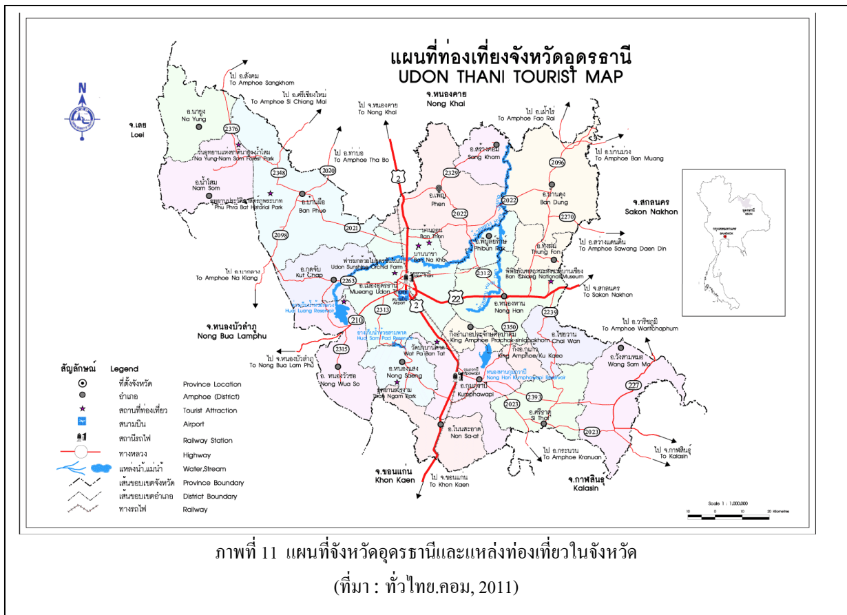
ภาพที่ 11 แผนที่จังหวัดอุดรธานีและแหล่งท่องเที่ยวในจังหวัด

จังหวัดอุดรธานี แบ่งเขตการปกครองออกเป็น 20 อำเภอ ได้แก่ อำเภอเมืองอุดรธานี อำเภอกุศจับ อำเภอหนองวัวซอ อำเภอกุมภวาปี อำเภอโนนสะอาด อำเภอหนองหาน อำเภอทุ่งฝน อำเภอไชยวาน อำเภอศรีธาตุ อำเภอวังสามหมอ อำเภอบ้านดุง อำเภอบ้านผือ อำเภอน้ำโสม อำเภอเพ็ญ อำเภอสร้างคอม อำเภอหนองแสง อำเภอนายูง อำเภอพิบูลย์รักษ์ อำเภอกู่แก้ว อำเภอประจักษ์ศิลปาคม 156 ตำบล 1,880 หมู่บ้าน (ในเขตเทศบาลและนอกเขตเทศบาล) การปกครองส่วนท้องถิ่น ประกอบด้วย องค์การบริหารส่วนจังหวัด 1 แห่ง เทศบาลนคร 1 แห่ง เทศบาลเมือง 3 แห่ง เทศบาลตำบล 49 แห่ง และ องค์การบริหารส่วนตำบล 127 แห่ง มีประชากรทั้งสิ้น จำนวน 1,538,940 คน เป็นเพศชาย 769,448 คน (49.999%) เพศหญิง 769,492 คน (50.001%) จำนวน 422,109 ครัวเรือน ความหนาแน่นของประชากร 131.19 คนต่อตารางกิโลเมตร (ที่มา : กรมการปกครอง กระทรวงมหาดไทย, ข้อมูล 31 ธันวาคม 2552)