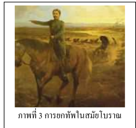
ภาพที่ 3 การยกทัพในสมัยโบราณ

ในสมัยกรุงรัตนโกสินเป็นราชธานีนั้น จังหวัดอุดรธานีได้เกี่ยวข้องกับการศึกสงครามกล่าวคือใน ระหว่าง พ.ศ.2369- 2371 ได้เกิดกบฏเจ้าอนุวงศ์ยกทัพเข้ามายึด เมืองนครราชสีมา ซึ่งมีผู้นำคือคุณหญิงโม(ท้าวสุรนารี) กองทัพ เจ้าอนุวงศ์ได้ถอยทัพมาตั้งรับที่เมืองหนองบัวลำภู และได้ต่อสู้ กับกองทัพไทยและชาวเมืองหนองบัวลำภูจนทัพเจ้าอนุวงศ์แตก พ่ายไป กระทั่งในปลายสมัยสมเด็จพระจอมเกล้าเจ้าอยู่หัว รัช การที่ 4 ประมาณ พ.ศ.2411 ได้เกิดความวุ่นวายขึ้นในมณฑลลาว พวน เนื่องจากพวกฮ่อซึ่งกองทัพไทยได้ยกขึ้นไปปราบปราม จนสงบได้ชั่วคราว