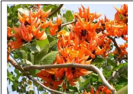
ภาพที่ 8 ดอกไม้ประจำจังหวัดอุดรธานี

ดอกทองกวาว" หรือดอกจาน ตามภาษาอีสาน เป็นต้นไม้ที่มีดอกสีแสดสวยงามมาก จะ ออกดอกในช่วงเดือนเมษายนของทุกปี ซึ่งมีความหมายหลายประการ คือพระนามเดิมของพลตรีพระเจ้า