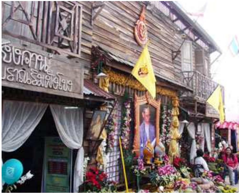
ภาพที่ 30 ร้านนิทรรศการ สพป. เลข 1