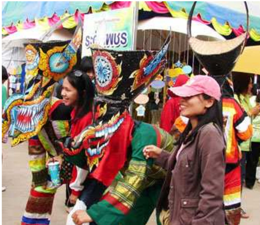
ภาพที่ 33 ผี ผี ผีตาโขน เป็นตะ-ย่าน (นำกลั้ว)