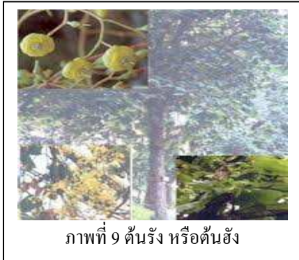
ภาพที่ 9 ต้นรัง หรือต้นฮัง

ต้นรังหรือต้นฮัง เป็นไม้ยืนต้นผลัดใบ สูง 15-20 เมตร ใบรูปไข่ ดอกสีเหลือง มีกลิ่นหอม ออกดอกในช่วงเดือนมีนาคม-เมษายน